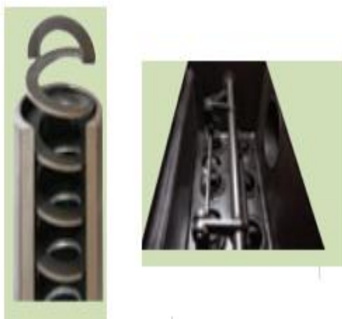
Slika 3

Prez sodobnega uplinjevalnega kotla z dvojno vrtinčasto izgorevalno komoro podaja slika 4