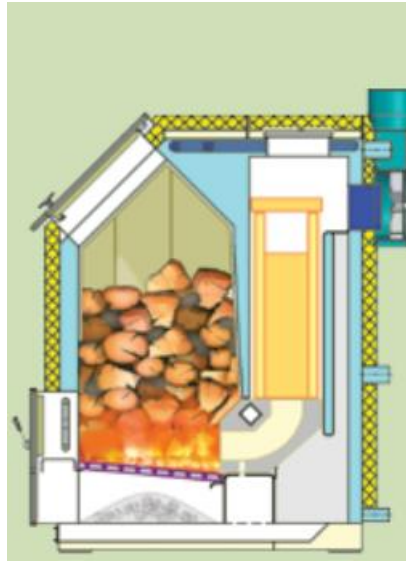
Slika 1 kotel z odgorevanjem

Predhodnik sodobnih uplinjevalnih kotlov je kotel s spodnjim odgorevanjem. Enega od takih prikazuje spodnja slika 1.